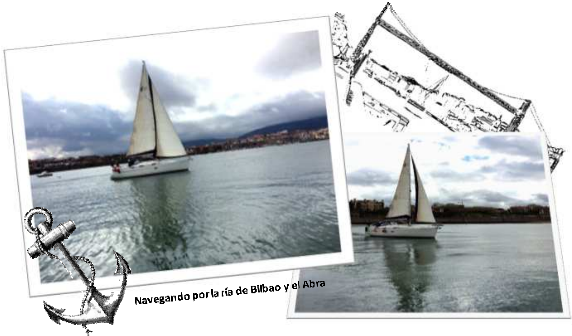
Navegando por la ría de Bilbao y el Abra

EVENTOS CORPORATIVOS | CONGRESOS | FERIAS | CRUCEROS >>> BILBAO OUTDOOR EXPERIENCE >>>